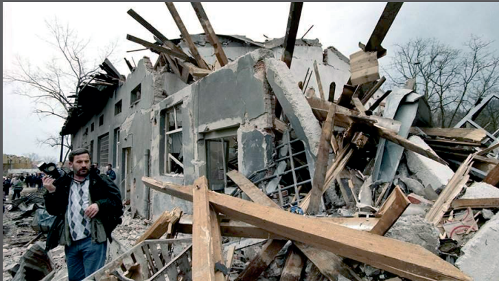
Последствия налетов бомбардировок Югославии