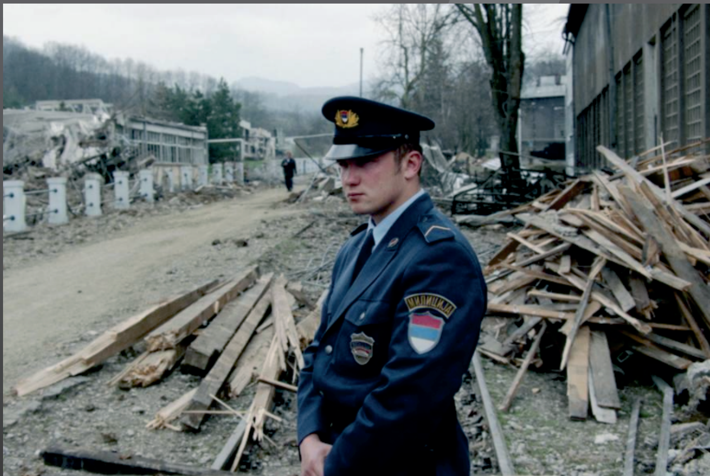
Вблизи разрушенной фабрики электробытовых изделий в городе Чачак