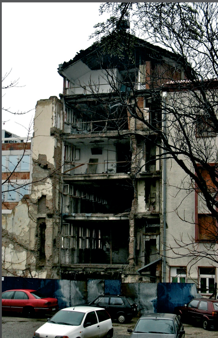
Уничтоженное натовским ударом 23 апреля 1999 года здание Радио и Телевидения Сербии