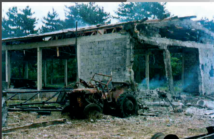
Уничтоженная авиацией НАТО овцеводческо-козоводческая ферма предприятия «Эко храна» в с. Подгорац