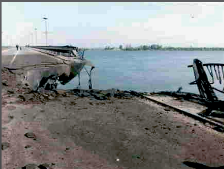
Разрушенный НАТО мост в г. Нови-Сад