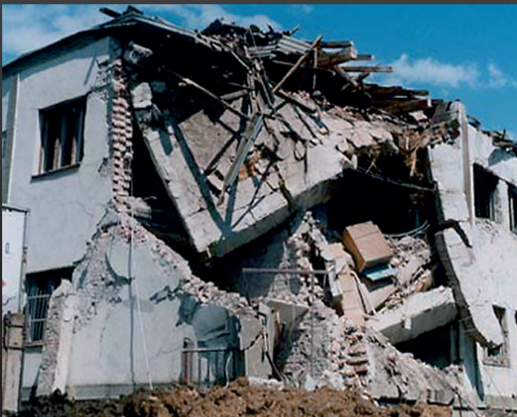
Разрушения в г. Ниш в результате авиационных ударов НАТО в 1999 году