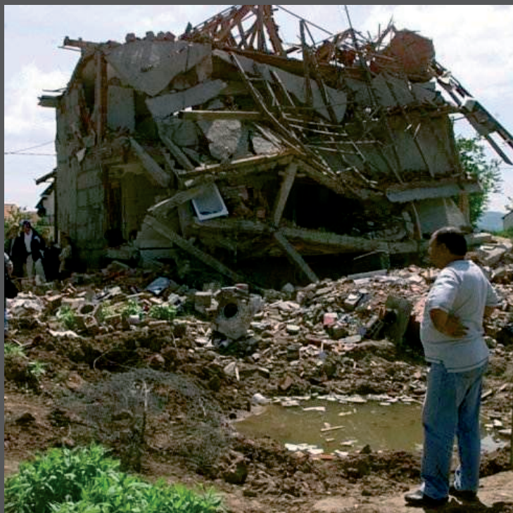
Последствия бомбардировки города Чуприя