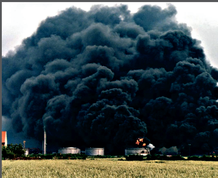
Удар НАТО по НПЗ г. Панчево