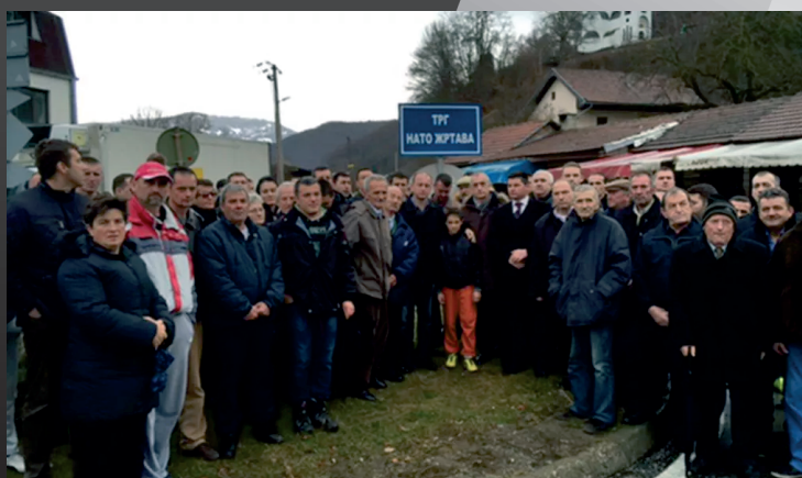
Площадь жертв НАТО в память о погибших в селе Мурино

Авиация НАТО намеренно и неоднократно осуществляла атаку мирного города Чуприя. За время агрессии НАТО наносила удары по городу 11 раз. Первый удар ракетами был осуществлен 8 апреля 1999 года. В интервью информационному агентству «Танюг» в апреле 2014 года мэр города Владимир Стойкович вспоминал: «В результате первой бомбардировки авиации НАТО, начавшейся в ночь на 8 апреля 1999 года, 11 ракет уничтожили центр Чуприи. Тогда было полностью уничтожено 30 домов и 70 квартир в центре города. Были разрушены или повреждены здание компании «Электродистрибуция», универмаг «Меркатор», спортивная арена «Ада», начальная школа «Джуро Якшич».