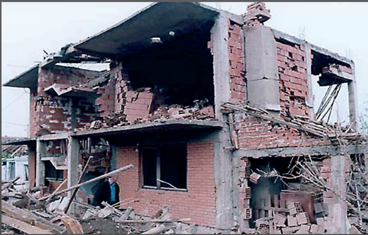
Последствия атаки НАТО на жилой квартал п. Шлака

20 апреля 1999 года бомбардировке НАТО подвергся поселок Шлака. В результате авиационных ударов в поселке уничтожено или повреждено 50 домов мирных граждан, убиты и ранены жители поселка.