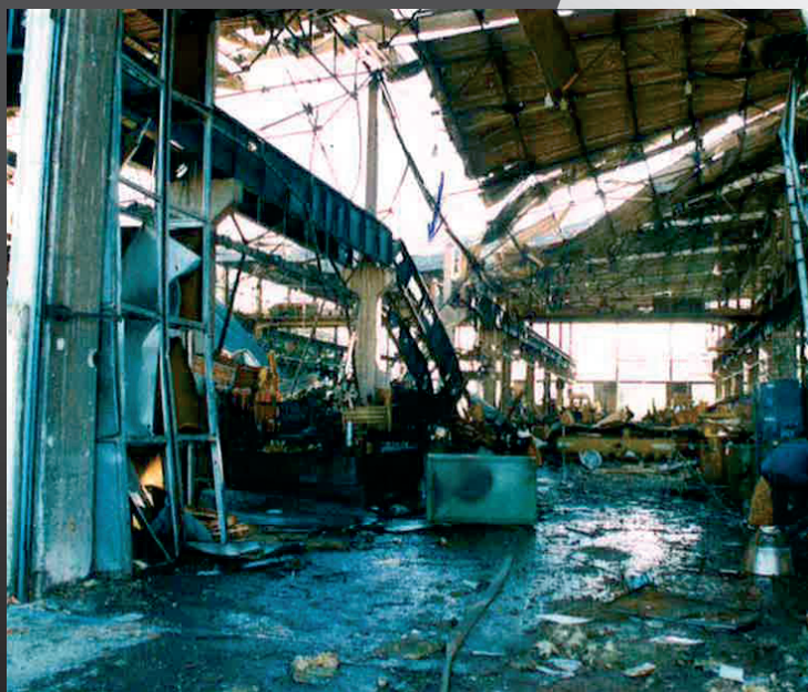
Разрушенный цех фабрики предприятия «14 октября» в г. Крушевац