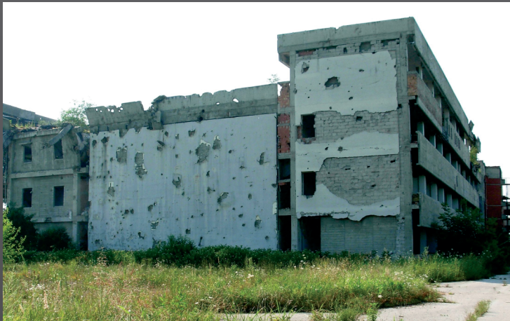
Разрушенное натовскими бомбардировками здание телеканала в Мишелуке