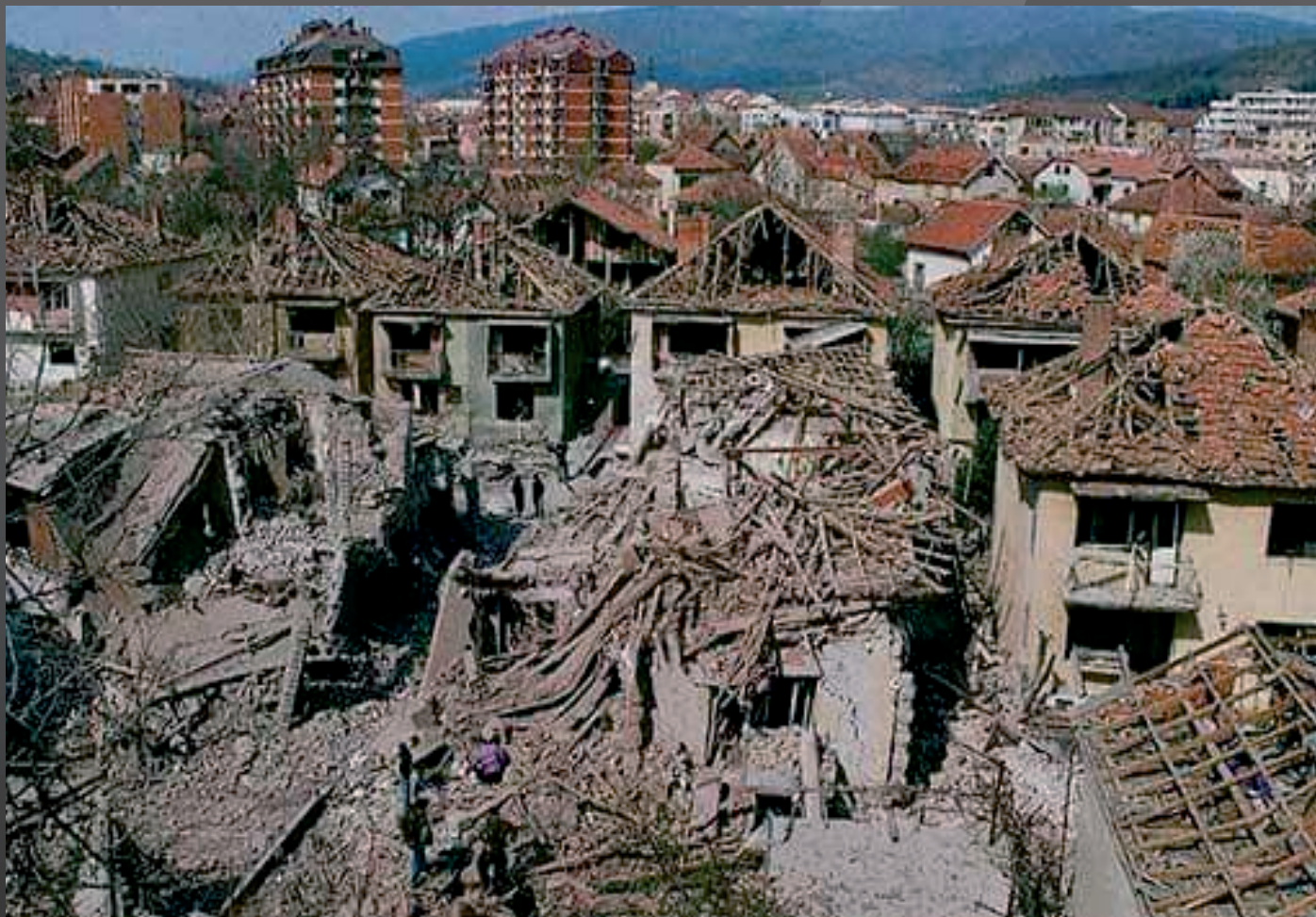
Последствия ракетного удара по г. Алексинац

5 апреля 1999 года авиаударом НАТО по г. Алексинац было убито 17 гражданских лиц. Было повреждено или уничтожено около 60 домов, одна из ракет попала в автошколу.