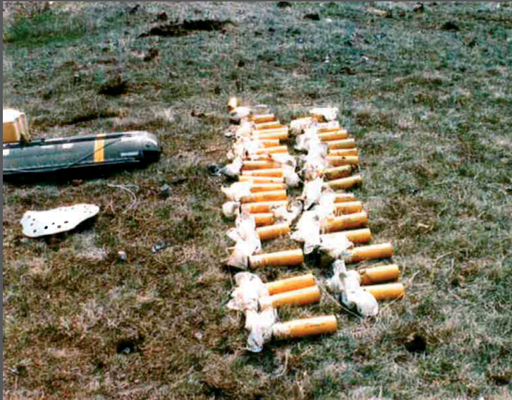
Неразорвавшиеся суббоеприпасы BLU97 A/B в районе Грачицы