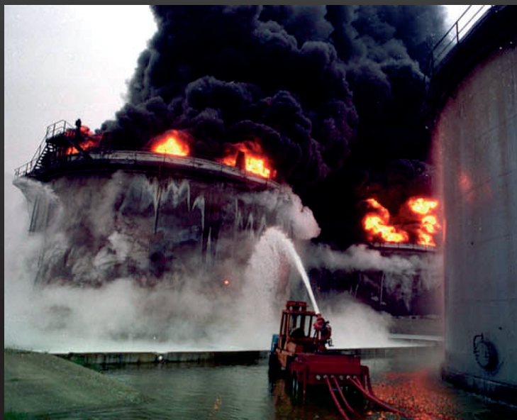
Удар НАТО по НПЗ в г. Нови-Сад