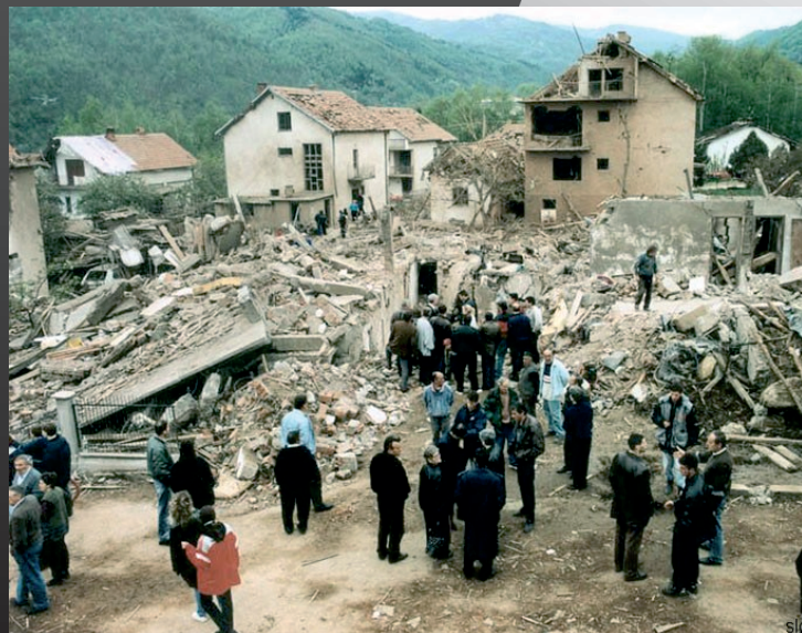
Результаты бомбардировки сербского города Сурдулица