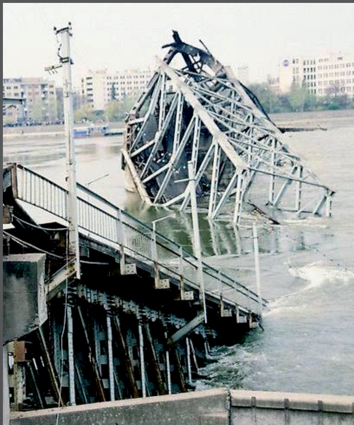
Результат бомбардировки Варадинского моста