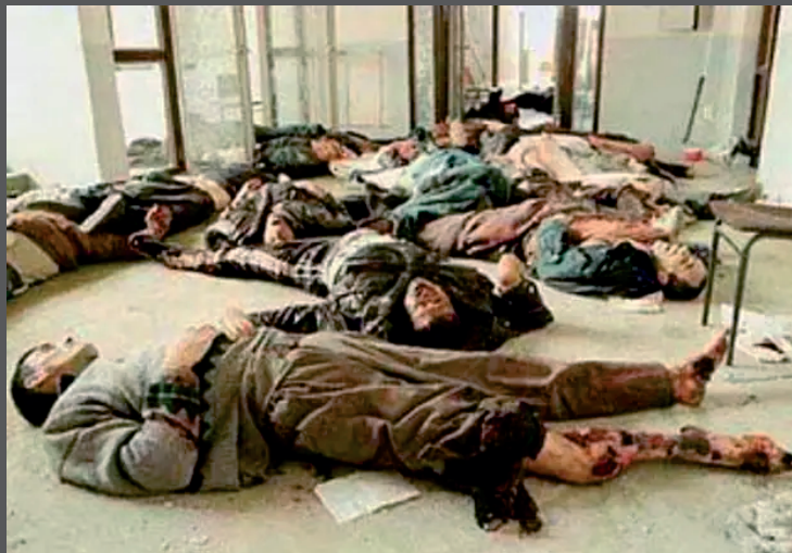
Последствия ударов НАТО по тюрьме Дубрава

Начиная с 19 мая 1999 года силы НАТО регулярно бомбили город Исток и тюремный комплекс Дубрава. В первый день от бомбардировки погибли трое заключенных и тюремный охранник. Два дня спустя НАТО был нанесен повторный удар по тюремному комплексу, в результате которого, по данным Human Rights Watch, погибло 19 заключенных.