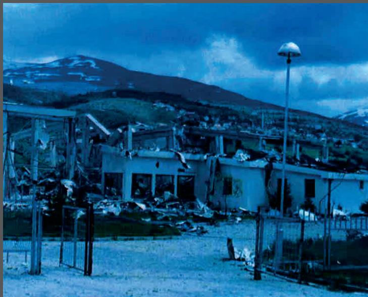
Уничтоженная авиацией НАТО фабрика легкого белья предприятия «Шар производи» в с. Драгаш