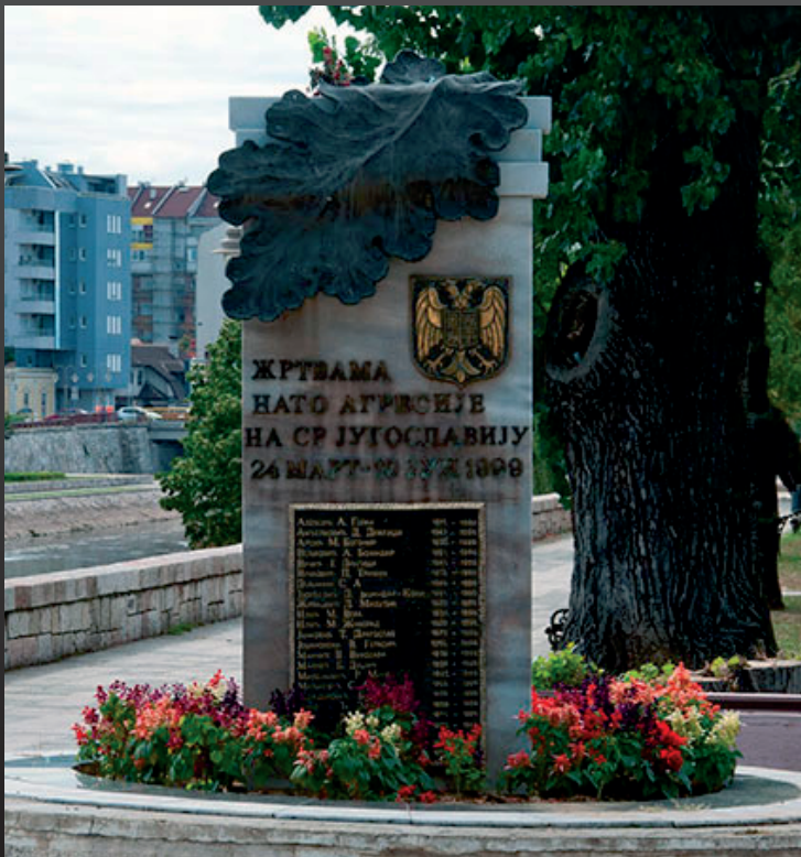
Памятник жертвам натовской бомбардировки, г. Ниш