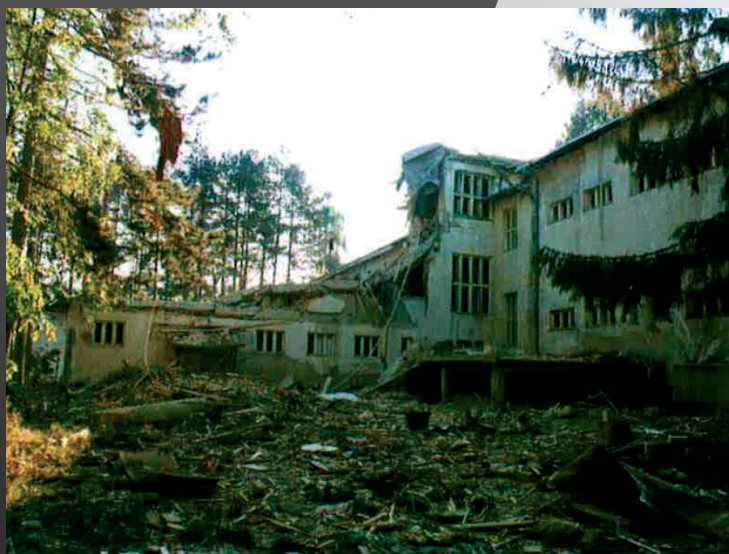
Последствия натовской бомбардировки г. Сурдулица

14 апреля 1999 года авиация НАТО разбомбила колонну мирных жителей под селом Донья Србица на региональной автодороге Призрен - Джаковица. В результате авиационного удара погибли минимум 6 человек, ранения получили 11 человек.