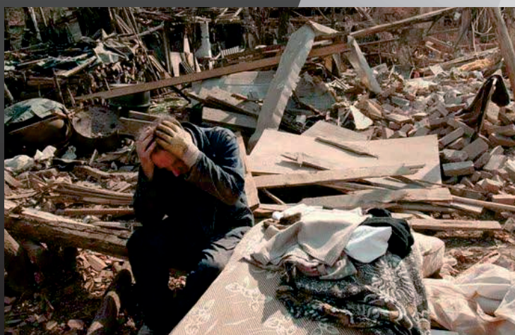
Последствия бомбардировок НАТО