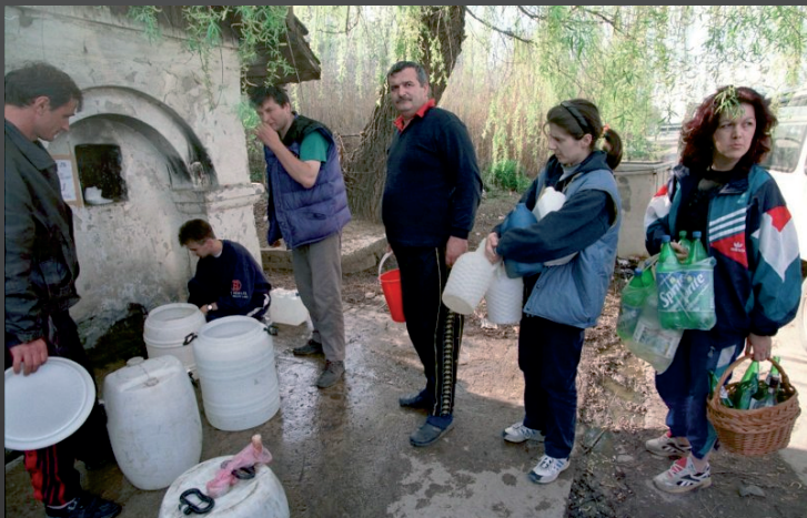
После разрушения мостов через Дунай в Нови-Сад жители городского района Петроварадин остались без питьевой воды.