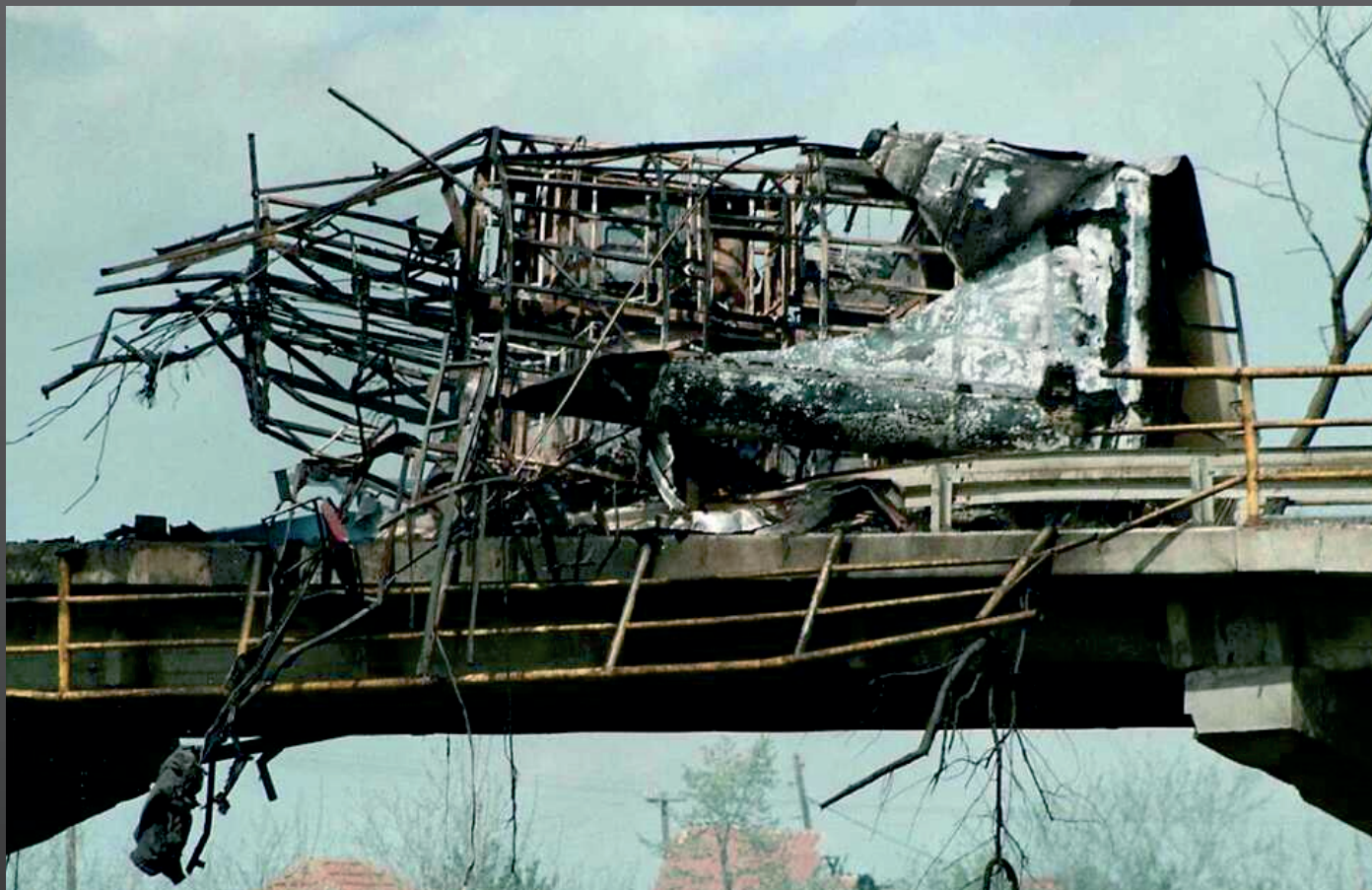
Остатки пассажирского автобуса, уничтоженного ракетным ударом НАТО.

1 мая 1999 года в Косово, с. Лужане самолет НАТО совершил атаку на пассажирский автобус транспортной компании «Ниш-Экспресс», следовавший по маршруту Ниш – Приштина. В результате попадания выпущенной им ракеты было убито 46 мирных жителей, в том числе 14 детей.