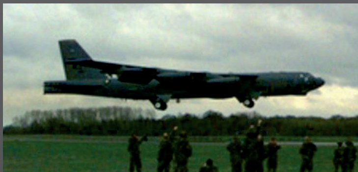
Американский самолет B52H (боевая нагрузка составляет до 32 000 кг бомб и ракет) вылетает на бомбежку Югославии из Великобритании