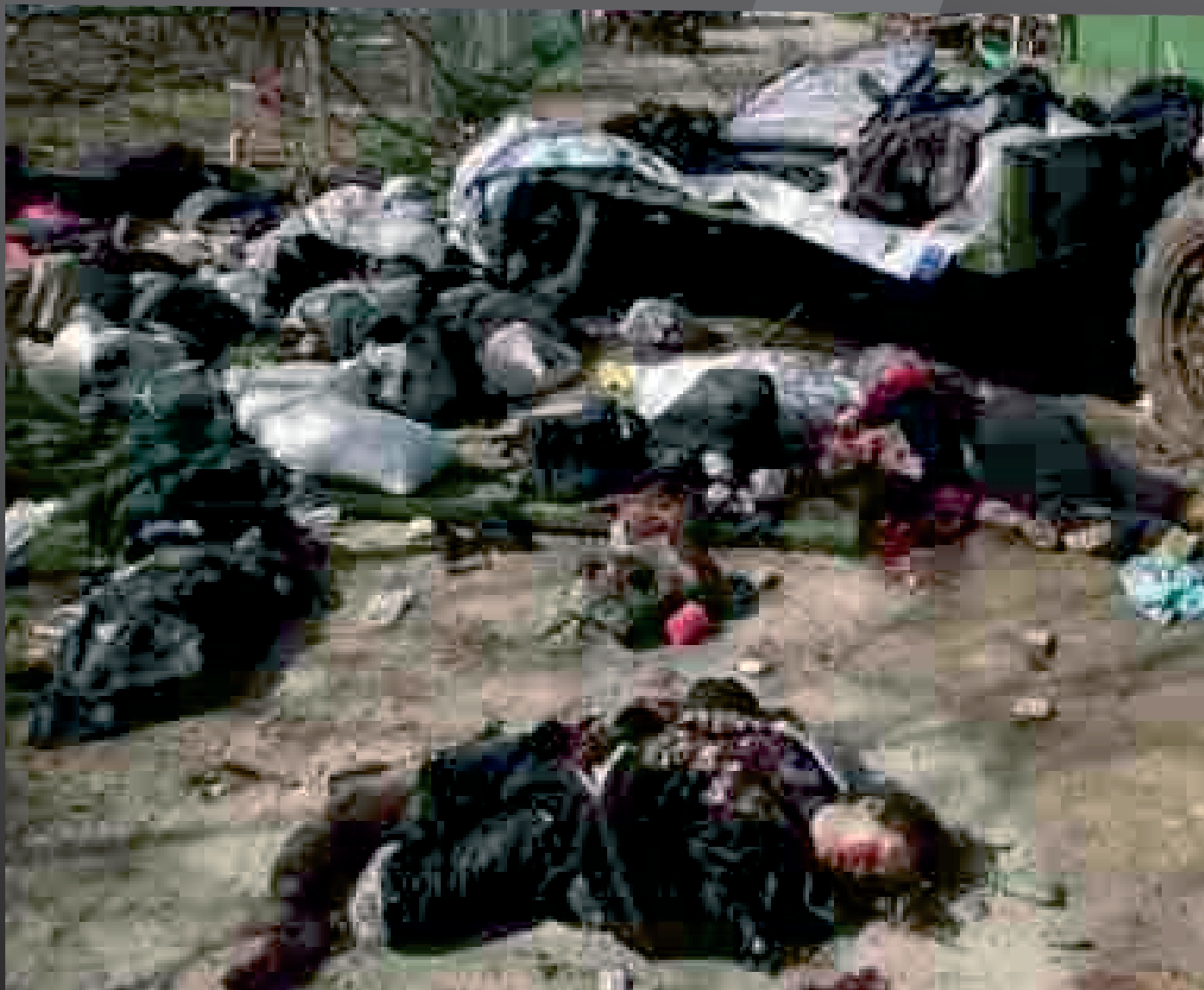
Последствия натовской бомбардировки деревни Кориша